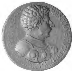
ALEXANDRE DES MEDICIS.